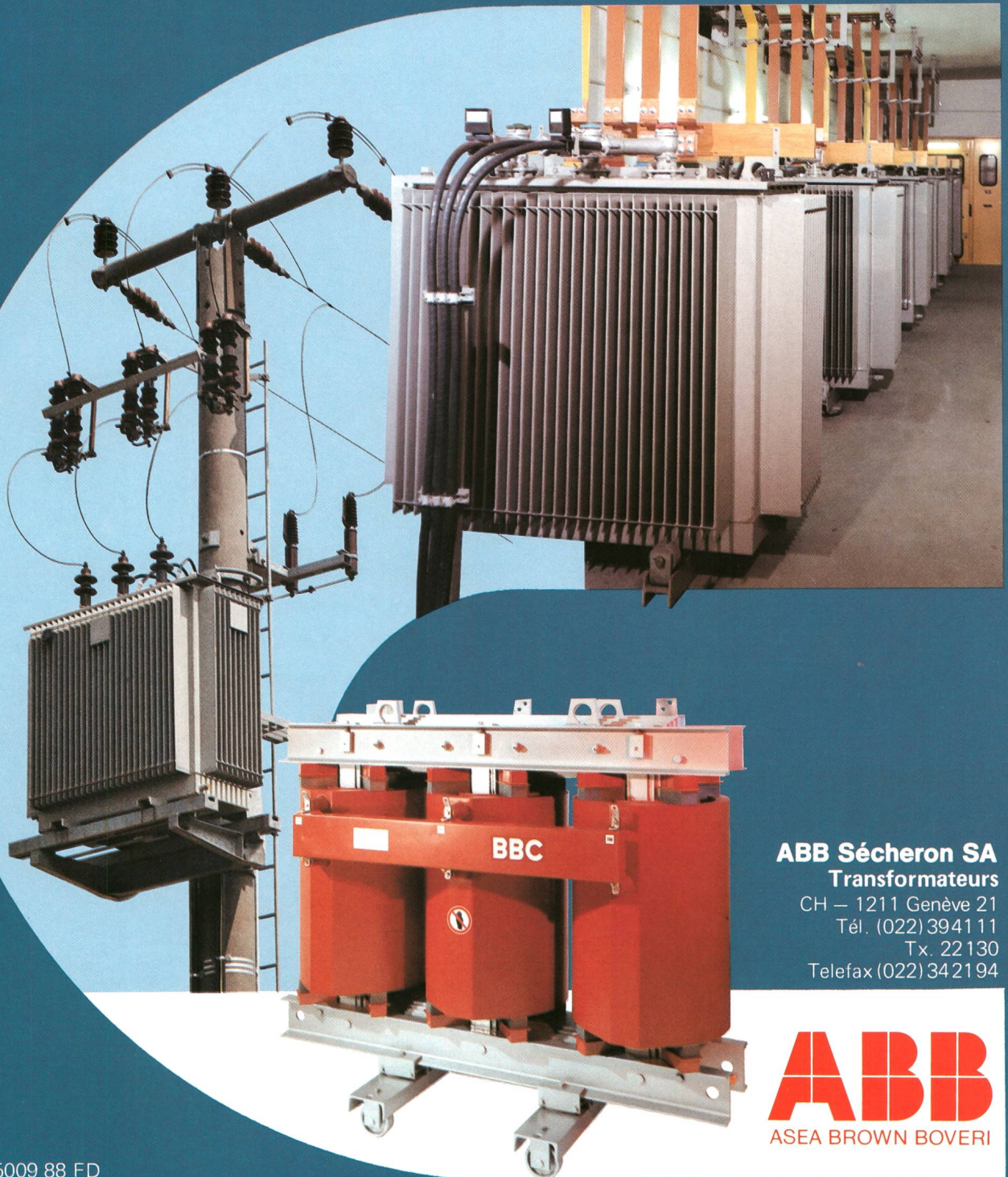
ABB Sécheron SA Transformateurs

CH – 1211 Genève 21 Tél. (022) 3941 11 Tx. 22 130 Telefax (022) 34 21 94