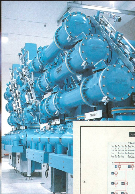
Feldmodul TELEGYR® 809L

*ILSA Integrierte Leittechnik in Schalt-Anlagen