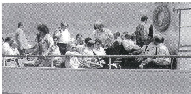
Eine Schifffahrt auf dem Luganersee bildete den Schlusspunkt der Jubilarenfeier 1989