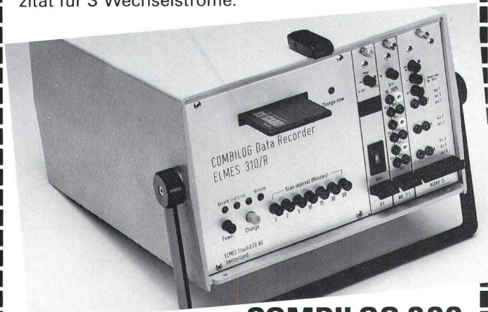
COMBILOG 300 der universelle

Praxisgerecht und wirtschaftlich, hohe Speicherkapazität für 3 Wechselströme.