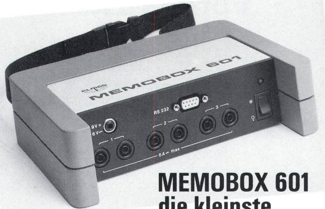
MEMOBOX 601 die kleinste

Praxisgerecht und wirtschaftlich, hohe Speicherkapazität für 3 Wechselströme.