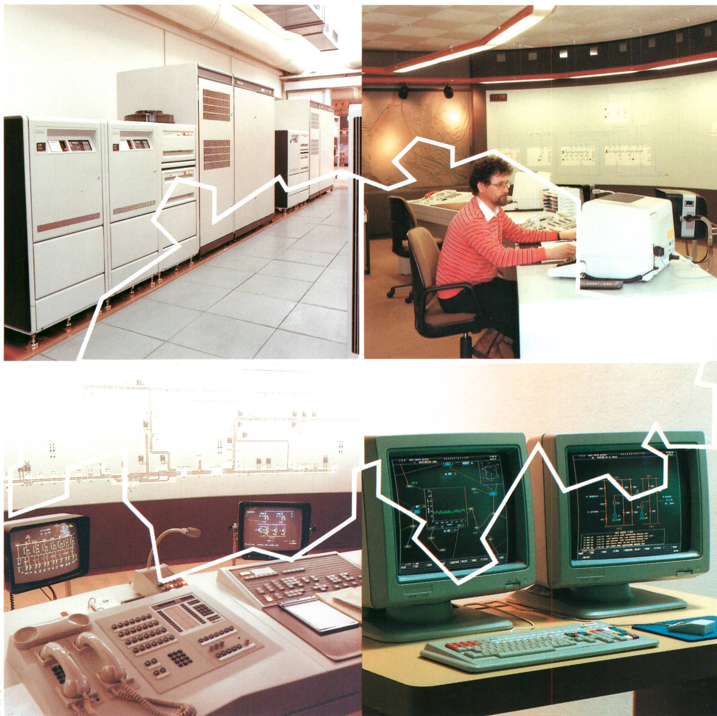
ABB Netzleittechnik baut Anlagen angepasst an Ihre Bedürfnisse, von kleinen Gemeindewerken bis zu Höchstspannungsnetzen. Geeignet für elektrische und nicht-elektrische Anwendungen.