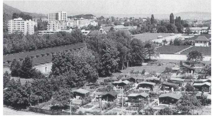
Figur 2 Fotomontage Sonnenkraftwerk Seewasserwerk Moos