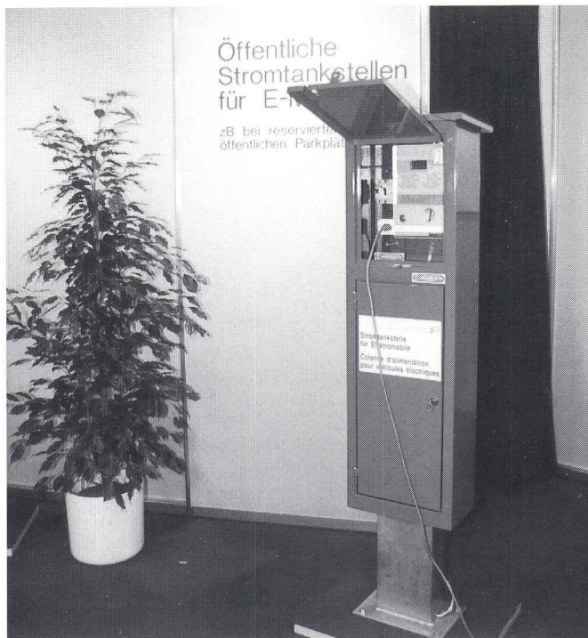
Am 2. Solarmobilsalon in Basel stellte der VSE eine von ihm entwickelte «Stromtankstelle» für Elektromobile vor.

Les colonnes d'alimentation sont équipées d'un compteur à prépaiement et d'un compteur d'électricité étalonné ainsi que des coupe-circuit et disjoncteurs nécessaires. Branchées sur une prise de courant normale (220 V), les batteries du véhicule se rechargent après introduction de la monnaie dans le compteur. La colonne d'alimentation peut aisément être utilisée dans des parcs de sta-