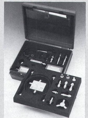
Messzubehör für SNA

Die Messbrücken RFZ-1 (bis 180 MHz) und RFZ-6 (bis 3,2 GHz) ermöglichen Reflexionsmessungen in Verbindung mit den Spektrum- und Netzwerkanalysatoren SNA-2, SNA-3 und SNA-6. Grunddämpfung