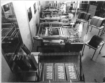
Herstellung von Leiterplatten in Siebdruck-Technik

einen Jahresumsatz von rund 10 Millionen Franken (11,3% des Gesamtumsatzes der Fela-Gruppe im Jahre 1989). Die Fela Leiterplattentechnik AG ist heute in der Lage, Leiterplatten mit 0,2 mm Leiterbahnabstand und -breite in Serie zu produzieren, wie sie üblicherweise nur mit Fotodrucktechnik hergestellt werden.