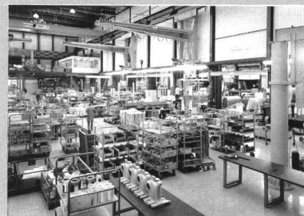
Überschaubare flexible Produktionseinheit mit klaren Abläufen

eine Halbierung der Durchlaufzeiten und der Lagerbestände und damit auch der entsprechenden Kapitalbindungen ermöglichen. Sie wird ABB auch erlauben, noch flexibler auf Kundenbedürfnisse einzugehen.