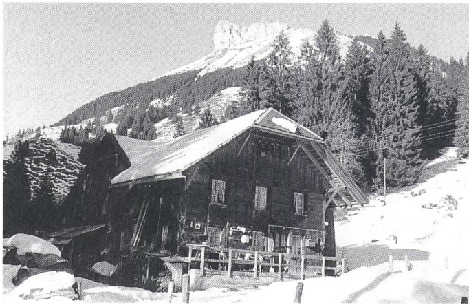
Seit Ende der 40er Jahre wurden 1100 Bergliegenschaften an das Verteilnetz der CKW angeschlossen

gen. Neu zugeteilt ist der Direktion Bau auch der Bereich Bau und Liegenschaften, soweit es die eigentlichen Bauaufgaben betrifft. Die Liegenschaftsverwaltung verblieb in der Kaufmännischen Direktion.