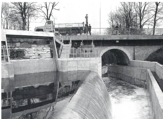
Das Kleinwasserkraftwerk Roggwil, im Kanton Bern, hat eine installierte Leistung von 250 kW. Dies entspricht etwa 10% des maximalen Leistungsbedarfs der Gemeinde Roggwil

La petite centrale hydraulique de Roggwil (BE) a une puissance installée de 250 kW. Ceci correspond à 10% environ de la demande de puissance maximale de la commune de Roggwil