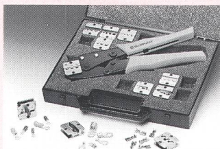
Burndy Y16R mit Koffer

garantiert. Es gibt Gesenke für isolierte und nichtisolierte Quetsch- und Rohrkabelschuhe, Aderendhülsen und Flachsteckhülsen gerade und 90° abgewinkelt, mit Quetsch-, Stempel- und Hexagonalverpressung. Die Gesenke sind leicht auswechselbar und haben einen Verdrehenschutz, welcher eine ungewollte Beschädigung durch falsche Montage verhindert. Für grössere Serien ist eine pneumatische sowie eine elektromagnetische Presse lieferbar, welche ohne Einstellarbei-