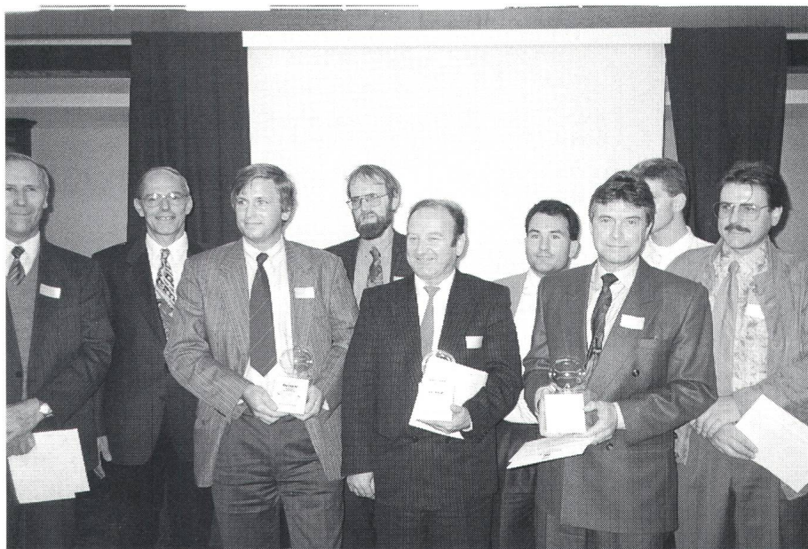
Bild 1 Die Preisträger des Prix «eta» 1991 anlässlich der Verleihung in Genf

Der erste Preis für Unternehmen mit bis zu hundert Beschäftigten ging an die Soltherm AG, Ingenieurbüro für technische Entwicklungen, in Altendorf. Diese Firma hat eine Klimaanlage für Fabriken gebaut, die ein Drittel weniger kostet als herkömmliche Anlagen. Sie