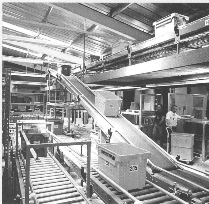
Sichtbarer Teil einer Verteilzentrum- Logistik

Mit dem neuen Verteilzentrum betreut die Niederlassung Lausanne der Elektro-Material AG die Kantone Waadt, Freiburg, Neuenburg und Wallis. Das Lagersortiment umfasst über 20000 Artikel sämtlicher bedeu-