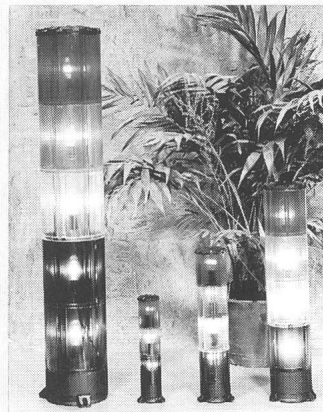
Optisches und akustisches Warnsystem

Das flexible, optische und akustische Warnsystem «Luxor» besteht in vier verschiedenen Größen, mit diversen Befestigungsarten und eignet sich für jede