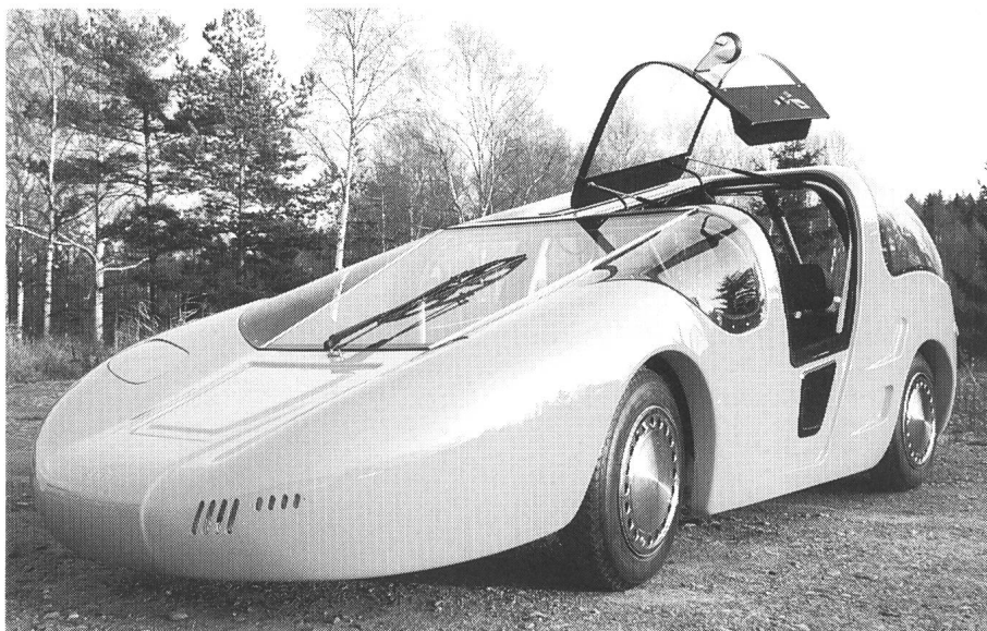
Rassige Prototypen aus Schweden (oben) und der Schweiz (unten)

Schwerpunkt des Gemeinschaftsstandes der Genfer Firma Scholl Sun Power und der französischen Automobilfirma Ligier bildet der neue «Optima», der – unter Verwendung von verschiedenen Antriebskomponenten aus Genf – nun vollständig in Frankreich produziert wird. Das mit einem von Scholl entwickelten Asynchronantrieb ausgerüstete Fahrzeug weist mit rund