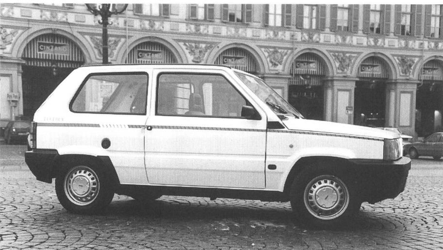
Fiat Panda «Elettra»: Rund 400 Fahrzeuge im Einsatz

Der Preis des Microcar «Light!» ohne Batterien wird voraussichtlich bei sFr. 22 535.– liegen, für die Batterien sind noch einmal sFr. 8800.– aufzuwenden, dafür erhält der Käufer jedoch eine 4-Jahres-Garantie auf die Batterie. Wer will kann – eine Neuheit – die Batterie auch leasen; der monatliche Preis dafür beträgt dann – bei vier Jahren Laufzeit – sFr. 226.–.