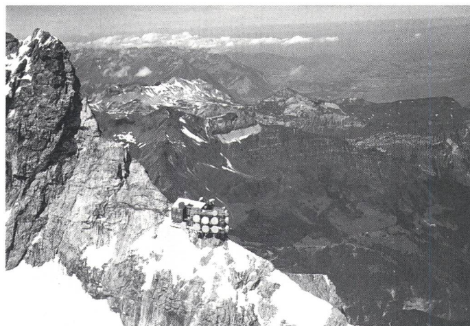
Bild 1 Optimal exponierte Richtstrahlstation Jungfrauojoch

Die Richtstrahlstation Jungfrauojoch dient primär der (drahtlosen) Übermittlung von Telefon- und Fernsehsignalen. Gebaut wurde sie ursprünglich für Verbindungen auf der Nord-Süd-Achse; heute wird sie aber gerade sehr für Verbindungen auf der West-Ost-Achse eingesetzt. Die Anlage Jungfrauojoch dient dabei nur als Relaisstation, das heisst Signale werden lediglich empfangen, umgelenkt und weitervermittelt, aber nicht aus-