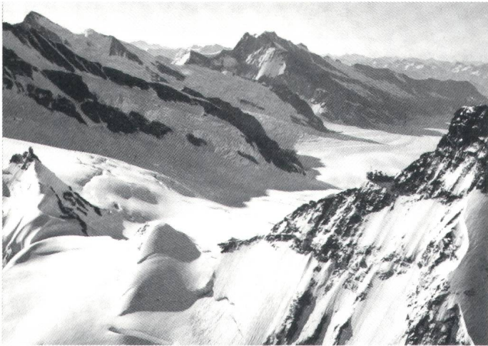
Bild 2 Blick auf Sphinx und Berghaus Jungfrauoch

gewertet. Die Übertragung der Telefon- und Fernsehsignale erfolgt im Frequenzbereich von 2 bis 13 GHz.