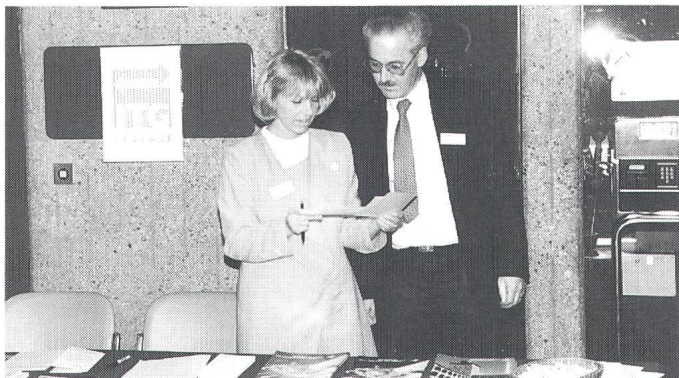
... und hinter den Kulissen