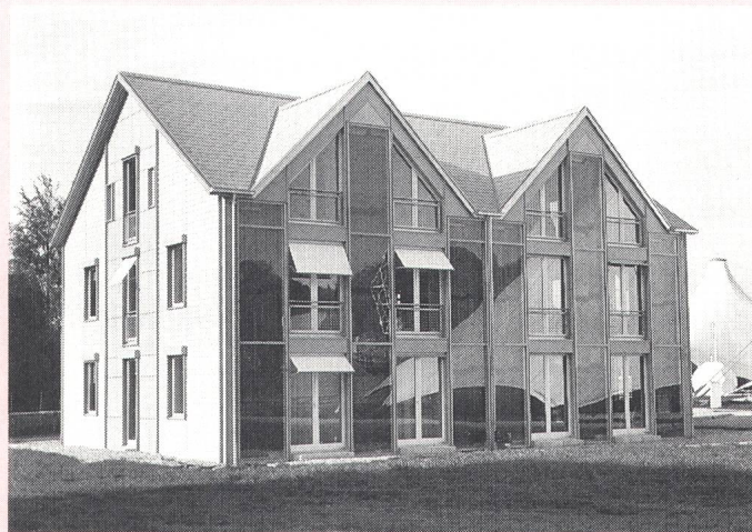
Prominentes P+D-Projekt: Nullenergiehaus der Heureka

Für die Beurteilung der Projekte und zur breiten Abstützung der Mittelzuteilung hat der Bund ein siebenköpfiges Komitee, das P+D-Komitee, eingesetzt, in welchem die Eidgenössische Energieforschungskommission Core, das Bundesamt für Energiewirtschaft (BEW), die kantonalen Energiefachstellen, die Industrie, die Höheren Technischen Lehranstalten sowie Infoenergie vertreten sind. Das einflussreiche Gremium hat jährlich rund 20 Millionen Franken zu vergeben, auch wenn es sich aus formalen Gründen nur um Anträge ans Bundesamt für Energiewirtschaft handelt. Grundsätzlich sind alle Verfahren, Materialien, Komponenten oder Anlagen als P+D-Projekt denkbar, sofern sie einen Beitrag zur rationellen Verwendung von Energie oder zur Nutzung erneuerbarer Energien leisten und die einschlägigen P+D-Bestimmungen erfüllen. Definitionsgemäss ist eine photovoltaische Stromerzeugungsanlage «ab der Stange» keine P+D-Anlage im Sinne des Gesetzgebers. Photovoltaik(PV)-Anlagen, die gemeinsam mit Elektro-Leichtfahrzeugen den weitaus grössten Anteil an den Gesuchen bilden, müssen noch ein anderes verwertbares Resultat liefern als bloss Strom. Unterstützungswürdig sind PV-Anlagen in Verbindung mit neuartigen, kostensparenden oder ästhetisch interessanten Fassaden- und Dachintegrationen, neuen –