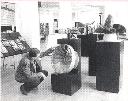
Energietechnik, einmal anfassbar

Aufgrund des grossen Interesses hat das Elektrizitätswerk der Stadt Zürich seine Ausstellung «Energie – mach mehr draus!» in der EWZ-Elexpo bis Ende Juli 1992 verlängert. Die Ausstellung nähert sich dem Thema Energie auf vielfältige Weise. So sind alle Primärenergieträger im Original ausgestellt: Erdöl, Braun- und Steinkohle, Uran, Holz, Wasser und Gas. Wer sich unter Energie nicht viel vorstellen kann, probiert am besten das Stromvelo. Eine durchsichtige Wasch-