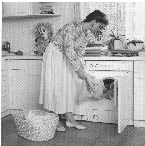
Die Kategorie Haushalt ist mit 4,8% am Strom-Mehrverbrauch beteiligt

Cette évolution de la consommation est due à la croissance d'environ 1% de la population suisse en 1991 ainsi qu'aux toujours plus nombreux