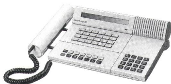
Das universelle Systemgerät Brigat 202 ist Komfort-, Team- und Chef-/Sekretärapparat in einem.