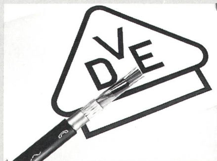
Brugger LWL-Kabel mit VDE-Prüfzeichen

Als erster nichtdeutscher und insgesamt sechster LWL-Kabelhersteller hat Brugg Telecom AG vom VDE (Verband Deutscher Elektroniker) das VDE-Zertifikat für Glasfaserka-