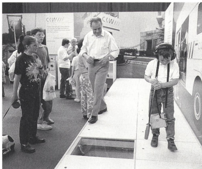
Die Kabelfehlerortung war Hauptanziehungspunkt des Stromtreffs der CKW an der Luga

Zum eigentlichen Anziehungspunkt des Standes entwickelte sich aber die Kabelfehleruche. CKW-Spezialisten hatten eine Kabelpiste angelegt, unter der drei Kabel verborgen waren. Diesen Kabeln wurde wahlweise eine Störung aufgeschaltet. Aufgabe des Besuchers war es nun, mit einem Kabelfehlerortungsgerät den Fehler zu suchen. Ein Lämpchen zeigte dann, ob sein detektivisches Gespür richtig war. Vor allem die kleinen Messebesucher