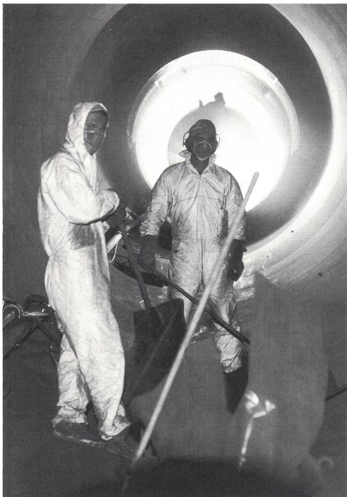
Travaux de peinture dans la partie blindée de la galerie