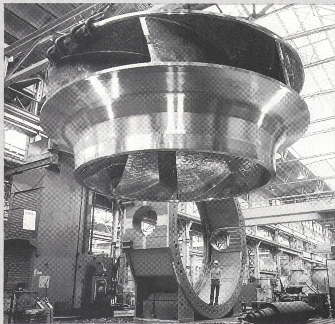
Lauftrad einer einstufigen 150-MW-Pumpturbine

überdurchschnittliche Einsatzbereitschaft der Mitarbeiter und Mitarbeiterinnen prädestinieren Zürich auch heute noch für die Produktion. Mit der neuen Fabrik will Sulzer-Escher Wyss Zürich bewusst als Industriestandort nutzen und eine produktorientierte Zusammenarbeitskultur fördern, die dem Unternehmen weiterhin seine Position im hart umkämpften Weltmarkt sichert.