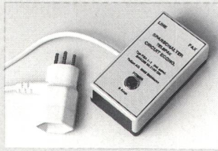
Energiesparen mit Fax-Sparschalter PSA-1-1

Telefaxgeräte haben, je nach Modell, im Stand-by-Modus einen Stromverbrauch von bis zu 100 Watt und mehr. Dieser unnötige Energieverbrauch belastet die Umwelt und das Portemon-