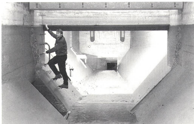
Das rund 400 Kubikmeter Wasser fassende, kombinierte Entsander- und Entkieser-Becken

ferten 4 zugrunde. Das Ergebnis darf sich sehen lassen: Auch unter extremen Verhältnissen bleibt die Anlage künftig einsatzfähig; dies bedeutet bessere Wassernutzung und höhere Stromproduktion.