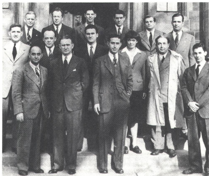
Der Forscher Enrico Fermi und sein Team Le chercheur Enrico Fermi et son équipe