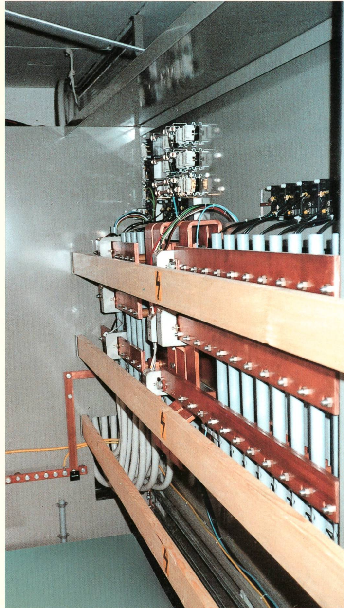
NSV 400/230 Volt in geschlossener Bauweise, Schalttafel bestückt mit den 3-polig schaltbaren, vollisolierten Lasttrenn-Sicherungen sowie einem Leistungsschalter

Unser umfassendes Sortiment lässt keine Wünsche offen