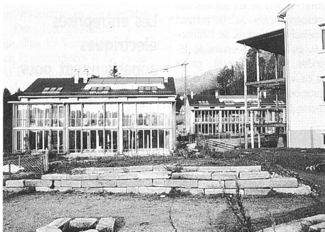
In Zukunft weniger Probleme für erneuerbare Energien in Gesetzen und Verordnungen? Diese Überbauung in Wald (ZH) wurde kürzlich mit dem SIA-Energiepreis 1992 ausgezeichnet