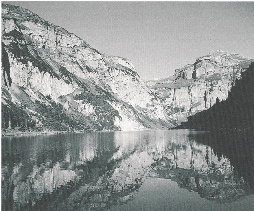
Figure 3 Nouvelle installation hydraulique: Ilanz II (étape Panix), ici le lac de Panix

Au vu des efforts visant à appliquer les débits minimaux plus élevés fixés par la loi révisée sur la protection des eaux avant l'expiration des concessions, il faut s'attendre, avant l'an 2000, à des pertes de la production d'électricité d'origine hydraulique, pertes qui ne pourront pas être compensées par la production d'autres centrales hydrauliques. Ceci constitue un obstacle supplémentaire à la réalisation de l'objectif «+ 5%» d'électricité d'origine hydraulique d'ici à l'an 2000.