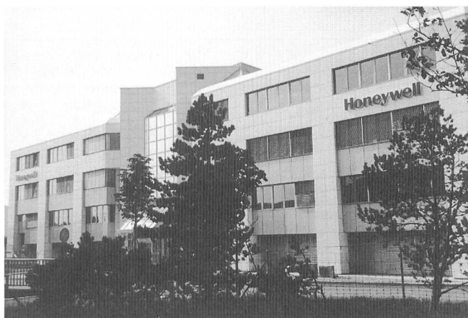
Der neue Hauptsitz in Wallisellen

Die kommende Hannover Messe '94 (20. bis 27. April 1994) verknüpft zwölf aufeinander abgestimmte industrielle Angebotsschwerpunkte. Aus dem Bereich der alle zwei Jahre vertretenen Branchen sind die Montage- und Handhabungstechnik einschliesslich Industrieroboter, die Materialflusstechnik und Logistik und die Oberflächentechnik dabei. Sie werden nahtlos integriert, indem sich die anderen auf der Hannover Messe ausstel-