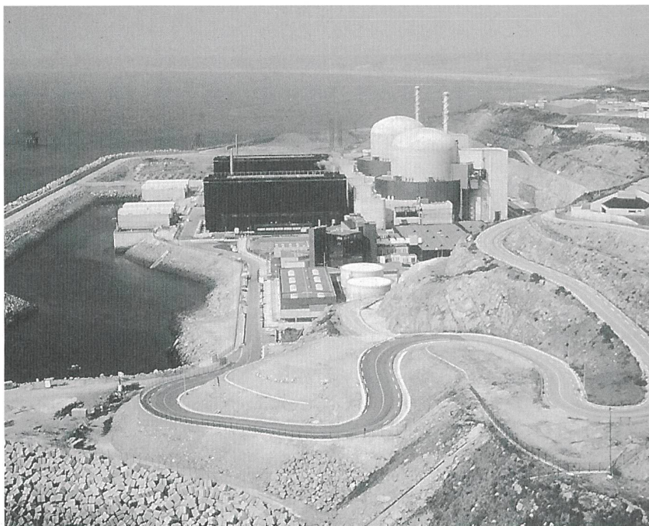
Bild 3 Kernkraftwerk Flamenville, Normandie: 2 Blöcke mit insgesamt 2660 MW

Auf diesem Gebiet ist die Logik festzustellen, dass die Länder mit anderen Energieressourcen als Uran versucht sind, eine «weiche» Haltung einzunehmen. Im Gegensatz dazu weisen die an Energieressourcen armen