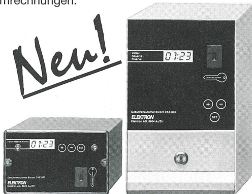
Neu: Bicont 803 – die bargeldlosen Gebührenautomaten

Exklusiv für Elektrizitätswerke: der EW-key zum Einziehen fälliger Stromrechnungen.