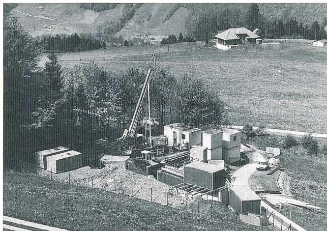
Eine der Sondierbohrungen am Wellenberg

Nach der erfolgten Standortwahl wird für das Lager kurzlebiger Abfälle am Wellenberg in diesem Sommer dem Bundesrat das Gesuch um Rahmenbewilligung unterbreitet. Hierfür und für die künftige Realisierung des Lagers soll spätestens zum Zeitpunkt der Gesuchseinreichung eine neue Gesellschaft, die «Genossenschaft für nu-