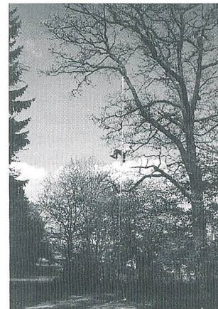
Ohne Problem können einzelne Äste über Strassen, in der Nähe von Stromleitungen zurückgeschnitten werden

Eine sichere und erst noch kostengünstige Lösung besteht darin, betriebseigenes Personal für solche Spezialfälle auszubilden und auszurüsten. In der Forstwirtschaft erprobt und bewährt, gibt es dafür verschiedene, ausgefeilte Techniken und Materialien. Mit der entsprechenden Ausbildung und Ausrüstung ist es also möglich,