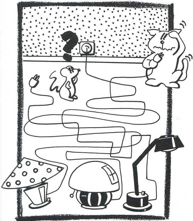
«Demand Side Management»: so nicht! Bessere Lösungen ergeben sich durch Kooperation und Eigeninitiative der Elektrizitätswirtschaft