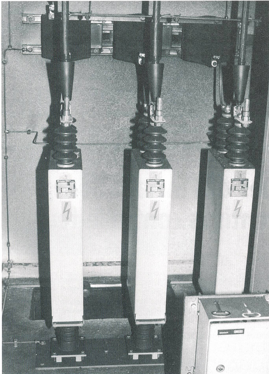
Figure 2 Exemple de filtre de couplage d'une télécommande centralisée endommagé par des fumées