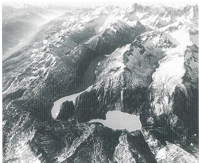
Alpen (im Vordergrund Grimsel-Gebiet): ökologisch und ökonomisch von Bedeutung

Nach Ansicht der Wasserwirtschaftsverbände sind der Schutz der Alpenregion und deren Nutzung nicht voneinander zu trennen; beide sind gleichwertig zu behandeln. Die in den Alpen lebende und dort arbeitende Bevölkerung sowie die unzähligen Gäste wollen sich im Natur- und Kulturräum «Alpen» wohlfühlen, dort leben und arbeiten können.