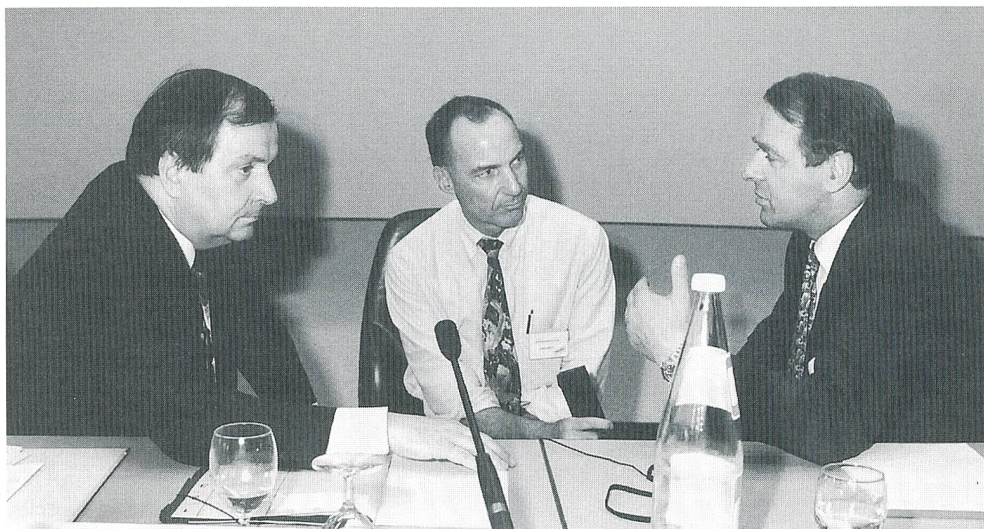
Europa und die Schweiz im Gespräch am Basler High-Tech-Forum: Bundesminister Klaus Töpfer (links) und Bundesrat Adolf Ogi (rechts) an der Pressekonferenz

Er warnte davor, dass Ökologie oder Ökonomie für sich alleine genommen zu Dogmen erstarren. Bezüglich der Dimension «Umwelt» formulierte Bundesrat Ogi die klaren umweltpolitischen Ziele der Schweiz mit den Hauptstichworten «Rio», «Luftreinhaltung», «Energie 2000». «Mit