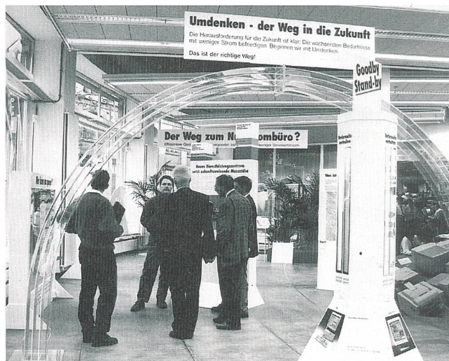
Die Ausstellung propagiert nicht den Weg zurück zu weniger Komfort, sondern den Weg zu überlegter und rationeller Stromanwendung

(infel) Eine Ausstellung mit dem provokativen Titel «Der