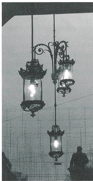
Alte Strassenlaternen am Zürcher Hauptbahnhof

(iwb) In den Auslagen der Schweizerischen Kreditanstalt in Basel konnte man von Mitte Oktober bis Ende November eine Ausstellung über nostalgische Strassenlaternen bewundern. Die Industriellen Werke Basel (IWB) und die Schweizerische Kreditanstalt (SKA) zeigten die schönsten Exemplare aus der Sammlung