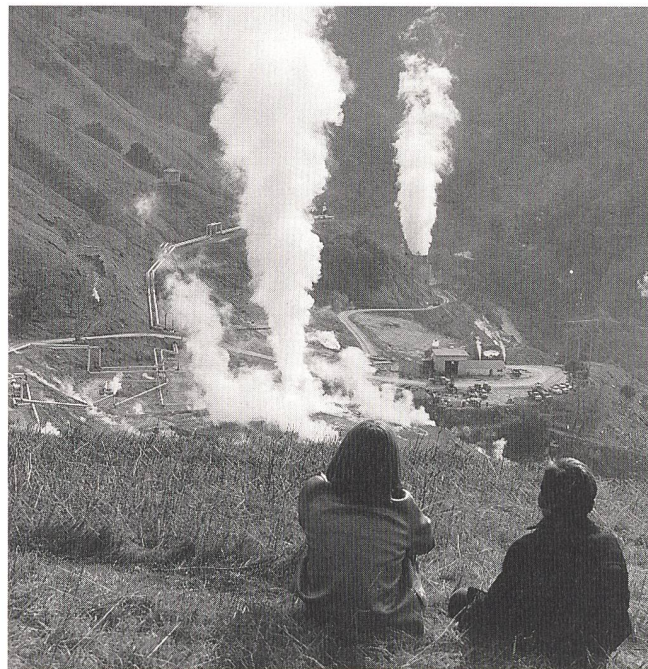
Geothermisches Kraftwerk «The Geysers» im Sanoma County, Kalifornien (Pacific Gas and Electric Company).

(vdew) Die westdeutschen Stromversorger erzeugten 1994 rund 93% mehr Strom aus Wind als im Vorjahr (etwa 200