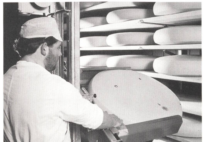
Käsepflege mit dem elektrisch betriebenen «Roboter». Damit werden die etwa zentnerschweren Emmentaler-Laibe aus den Gestellen gehoben und zurückgelegt.

Obwohl jedes Käserad nur alle paar Tage einmal drankommt, herrscht in der Halle reger Verkehr, und die Maschinen sind ausgelastet. Irgendeiner der vielen tausend Rundlinge ist immer unterwegs zur Wasch- und Wendemaschine. Als perfektes Wagenrad wird der Käse dann nach einem