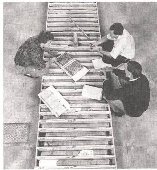
Endlagerung: Erdwissenschaftliche Untersuchungen von Bohrkernen.

(er) Die Regierung des Kantons Nidwalden hat am 17. Januar in ihrer Stellungnahme dem Bundesrat mitgeteilt, dass der Genossenschaft für nukle-