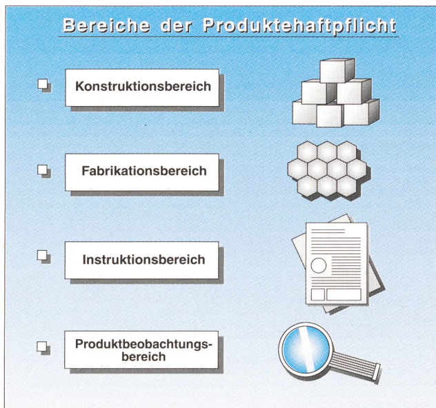
Bild 3 Von der Produkthaftungspflicht betroffene Verantwortungsbereiche

Unter Umständen kann die Haftung der Herstellerin nach Art. 5 PrHG ausgeschlossen sein, etwa wenn sie beweist, dass