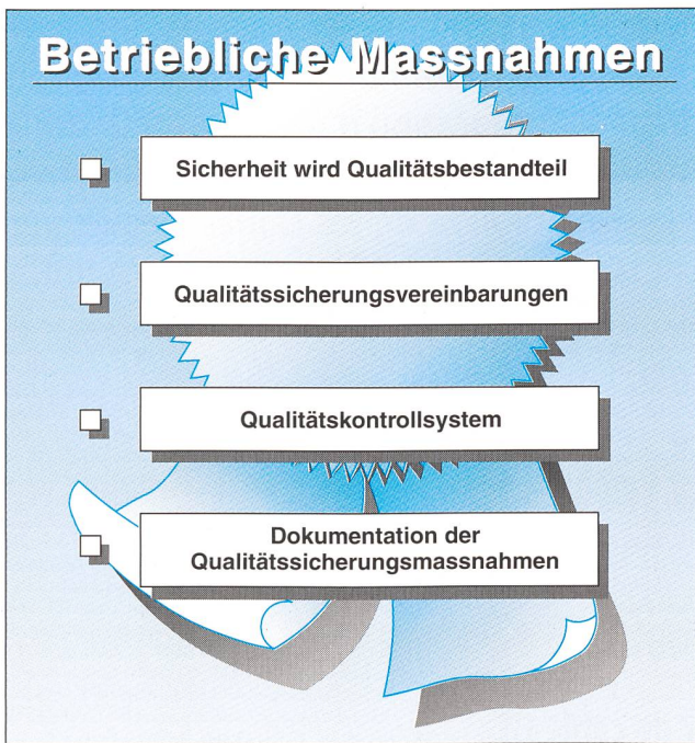
Bild 4 Massnahmen zur Vermeidung von Produktehaftpflicht-Ansprüchen

gesetzes. Alle Schäden, die an gewerblich genutzten Sachen entstehen, sind jedenfalls nach dem Produktehaftpflichtgesetz nicht zu ersetzen. Dies bedeutet etwa für den Zulieferer, dass er gegenüber dem Anlagen- und Gerätehersteller nicht haftet, wenn eines seiner Produkte an einer Anlage einen Schaden verursacht hat. Der Anlagen- und Gerätehersteller haftet nicht gegenüber dem Anlagenbetreiber, da dieser die Anlagen in aller Regel gewerblich nutzt. Der Anlagenbetreiber haftet gegenüber seinem Stromkunden nur, wenn die fehlerhafte Elektrizitätslieferung Schäden an privat genutzten Sachen verursacht hat; der Bereich der schadensträchtigen Industriekonsumenten wird nicht erfasst, da auch diese ihre Maschinen, Geräte und Verbrauchseinrichtungen in der Regel beruflich oder gewerblich nutzen.