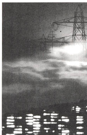
Elektrowatt: Licht, Wärme, Kraft – ausreichend, verlässlich und erschwinglich.

Rekordergebnis des Vorjahres mit 207 Mio. Franken annähernd wieder erreicht.