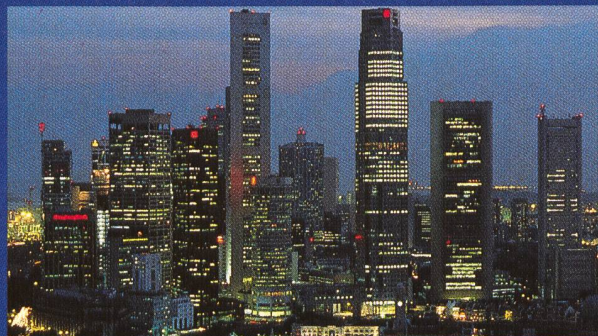
Singapur: Lieferung und Montage von Hochspannungskabeln

Das Vertrauen unserer Kunden fällt nicht einfach vom Himmel. Es erwächst aus dem Umstand, dass wir ihnen zuhören und stets engen Kontakt behalten. Daher können wir ihnen Produkte und Dienstleistungen auf dem letzten technologischen Stand nach Mass anbieten.