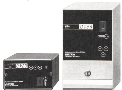
Bicont 803 – die bargeldlosen Gebührenautomaten

Exklusiv für Elektrizitätswerke: der EW-key zum Einziehen fälliger Stromrechnungen.