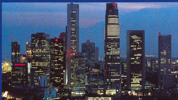
Singapour: fourniture et installation de câbles haute tension

Nous pouvons ainsi leur offrir des produits et services à leur mesure, issus des technologies les plus récentes.