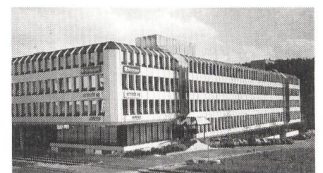
Stammsitz der Rotronic AG in Bassersdorf an bester Verkehrslage

Die in Bassersdorf domizilierte Rotronic AG feiert ihr 30jähriges Bestehen. Das 1965 gegründete Unternehmen ist bekannt als Spezialist auf dem Gebiet der Feuchte- und Temperaturmessung höchster Genauigkeit. Es führt im weiteren ein breites Angebot an Stromversorgungen, Steckverbindern, Lüftern und Kühlgeräten sowie 19-Zoll-Systeme, welche in Datenverarbeitung, Telekommunikation, Mess- und Regeltechnik, Raumfahrt, Verkehrstechnik, Forschung und