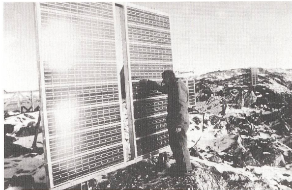
Solarzellen speisen eine abgelegene Richtfunkstation in Grönland.

(tic) Grönland ist 2650 km lang und 1200 km breit; es hat damit etwa die gleiche Fläche wie Saudiarabien. Aber im Gegensatz zum Königreich in der Wüste sind auf der grössten Insel der Welt jedoch 80% des Landes unter einer dicken Eisdecke begraben, die im Durchschnitt 1500 m und im Zentrum 3700 m dick ist.