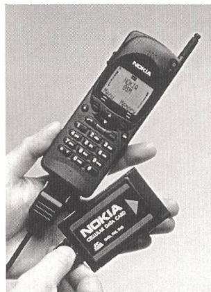
Datenfernübertragung mittels PCMCIA-Karte und Handy

Mit einem Natel D Handy, einer Cellular Data Card und einem Notebook können unabhängig vom Standort jederzeit