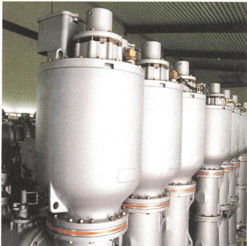
GASCOIL® SF6-isolierte Messwandler für autonome und integrierte GIS Anwendungen

Seit ihrer Gründung 1914 hat sich MGC zu einem führenden Hersteller von Leistungstransformatoren, Messwandlern sowie isolierten Stromschienensystemen etabliert. Vertreten in über 20 Ländern bietet MGC weltweit hochentwickelte, kundenspezifische Lösungen an. Profitieren Sie von unserem Know-how, unserer Qualität und Flexibilität. Auf Ihre Kontaktaufnahme freut sich: