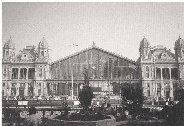
Budapest: Der Pester Bahnhof (Westbahnhof), der vom berühmten Gustave Eiffel erbaut wurde.

Die Tagung hat das Ziel, die Mitglieder der FKH und des VSE, die schweizerischen Elektrizitätswerke, die Herstel-