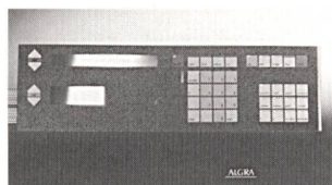
Dynapic-Membrane auf Kabelablängmaschine

Das sind Vorteile, die sich in allen Bereichen des täglichen Lebens bezahlt machen. Das von Algra ebenfalls entwickelte Dynasim erweitert das Anwendungsspektrum beträchtlich. Das zukunftsweisende