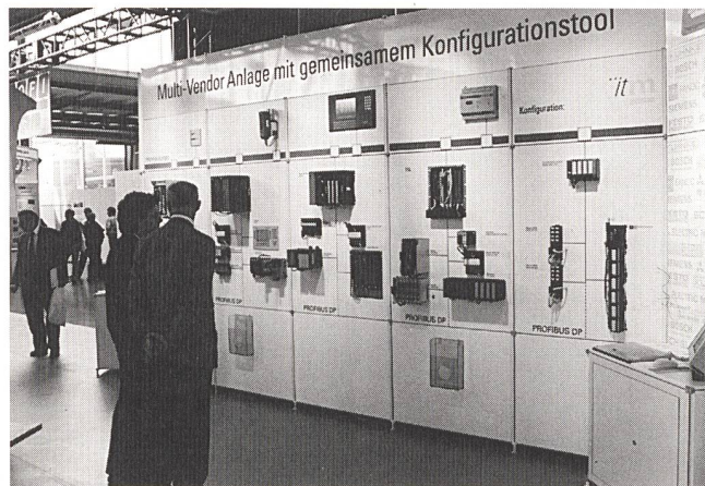
In einer Live-Applikation konnten sich die Besucher der Swiss Automation Week von der vollen Interoperabilität der Feldgeräte untereinander und mit den verschiedenen SPS-Systemen überzeugen.

Auf der diesjährigen Swiss Automation Week in Basel wurden die ersten Resultate der gemeinsamen Anstrengungen demonstriert. Die Messebesucher konnten sich in einer Live-Applikation von der Interoperabilität der Feldgeräte untereinander und den SPS-Systemen sowie der einfachen