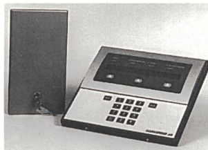
Einbruchmeldeanlage nach Schweizer Normen

Mit der Einbruchmeldeanlage Preemalon soll ein hohes Mass an Flexibilität und Interoperabilität in der Gebäudeautomation sichergestellt werden. Sie eignet sich speziell für Schweizer Einrichter von Hochsicherheitsanlagen und basiert auf der dritten Generation der Lonworks-Technologie von Echelon. Die Bus-Kommunikation Lonworks nützt alle Möglichkeiten der dezentralen Speicherung und Bearbeitung